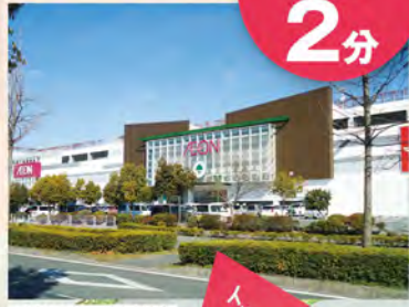
イオンモール姫路大津店

のぞみ野には2つの大型公園 大津茂小学校まで徒歩7分 周辺に子ども向け病院や総合病院が充実