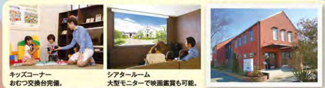
キッズコーナー おむつ交換台完備。