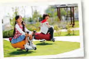
大津のぞみ野公園